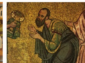
Божественная литургия была немыслима без Причастия