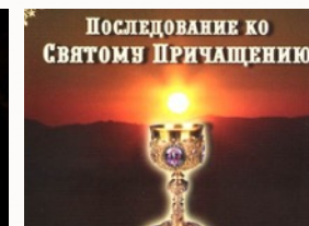
Дома прочитать Последование к Причащению