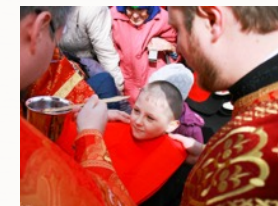
На Святках и Светлой неделе можно причащаться без поста

В том случае, если мы соблюдаем установленные Церковью посты и желаем причащаться ежесубботно, к Причащению можно приступать без дополнительного поста. Если мы приступаем к Причащению редко, лишь несколько раз в год, и при этом не постимся церковными постами, в этом случае нужно соблюдать трех-дневный пост перед Причащением. С полуночи до Причастия необходимо полное воздержание от пищи и питья.