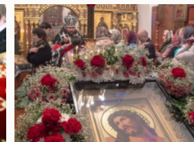
В Великом Посту можно причаститься вечером