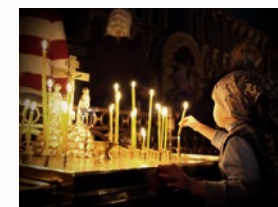
Перед Причащением не забыть прийти на вечернюю службу

Перед Причащением по возможности нужно посетить вечернее богослужение и дома прочитать Последование ко Святому Причащению. Вечерние и утренние молитвы читаются в обычном порядке. Молитвенное правило может также включать чтение канонов Спасителю, Божией Матери, Ангелу Хранителю и иных молитвословий.