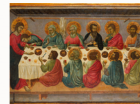
Каждая литургия есть повторение Тайной Вечери

Настолько часто, насколько этого требует наша совесть. В идеале нужно стремиться к тому, чтобы каждое посещение Божественной литургии сопровождалось бы причащением Святых Христовых Таин. Причащение должно стать неотъемлемой частью нашей духовной жизни, по слову Спасителя: «Ядущий Мою Плоть и пьющий Мою Кровь имеет жизнь вечную, и Я воскрешу его в последний день» (Ин. 6, 54).